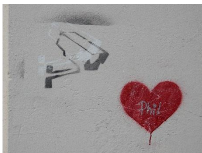
Abb. 2: CCTV (Chemnitz 2014)

Auf diese Weise kann in einem ersten Schritt ein Verstehen bei den Lernern jenseits ihrer zielsprachlichen Kompetenzen angestrebt werden. Dieses Verstehen ist die Basis, um inhaltliche Annahmen mit Hilfe der Zielsprache in einem zweiten Schritt zu verbalisieren. Auf diese Weise bieten die Werke ein enormes Potential, indem die Lernenden durch einen unmittelbaren visuellen Impuls Potential für vielfältige verbale Handlungen erhalten. Aufgrund der rudimentären Konstruktion der Werke mit gleichzeitig komplexer Aussage können die Werke zur Differenzierung genutzt werden. So lassen sich Werke sowohl lediglich beschreiben als auch umfassend reflektieren und diskutieren. Wie sich die jeweilige Auseinandersetzung mit einem Werk gestaltet, hängt von der Lernaufgabe und dem sprachlichen Niveau der Lernenden ab. Dabei lassen sich viele Werke finden, die sich fachübergreifend und/oder zum verstärkten kulturellen Auseinandersetzen mit Themen anbieten (vgl. Kap. 3.3). Der starke soziokulturelle und gesellschaftliche Bezug der Werke, der sowohl lokal als auch global brisant sein kann, eignet sich neben der Förderung sprachlicher Kompetenzen auch zur Erarbeitung der transkulturellen Kompetenz (vgl. Dausend 2014b: 96-97). Kulturelle Bedeutungsaushandlungen können konkret mit Street Art gefördert werden.