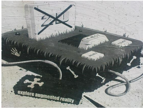
Abb. 1: explore augmented reality (Dresden 2014)

Denn auch wenn Street Art lokal verankert ist, wird es zunehmend zu einem globalen Phänomen. Die Werke sprechen vielfach Aspekte an, die im lokalen Kontext relevant sind und sich geografisch verorten lassen. Parallel zu dieser lokalen Bedeutung sind viele Werke global verständlich bzw. sprechen Themen an, die über die Region hinaus bedeutsam sind (vgl. Abb. 1). So kann zum einen an Vorwissen der Lernenden aus anderen Kontexten angeknüpft werden, zum anderen werden relevante Themen zum Unterrichtsinhalt. Diese müssen nicht zwangsläufig auf die Zielsprache und -kultur gerichtet sein, solange die Lernenden durch Lernaufgaben aufgefordert werden, Bedeutungen zielsprachlich zu verhandeln bzw. ein zielsprachliches Ergebnis zu produzieren (vgl. Kap. 3.3).