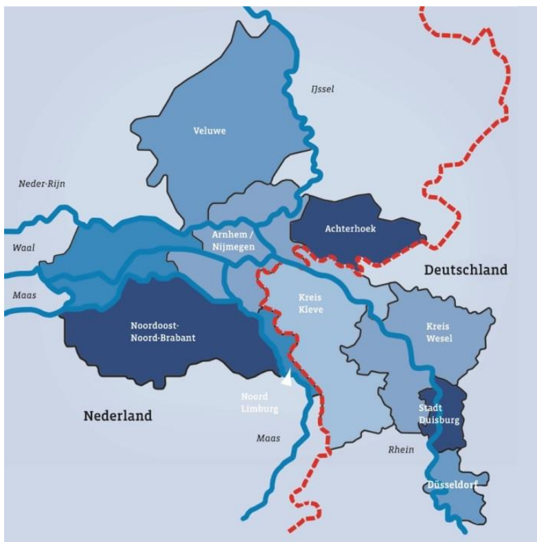
Abb. 1: Arbeitsgebiet der Euregio Rhein-Waal

Big stattfindende persönliche Austauschmomente über ein Schuljahr hinweg realisiert werden konnten. Hierbei standen gemeinsames Erleben und Lernmomente im Mittelpunkt, bei denen Ansätze des außerschulischen und erlebten Lernens hervorragend genutzt werden konnten (vgl. Frank/Jentges 2021), ebenso wie Projekte und Erkundungen im (urbanen) Raum (beispielsweise urban space - und linguistic landscape -Projekte, vgl. Jentges/Knopp/Sars im Druck; Jentges/Konrad 2021; Jentges/Sars 2018; Jentges/Sars 2021b; vgl. auch entsprechende Materialangebote auf der Projekt-Webseite: https://www.ru.nl/nachbarsprache/schulen/unterrichtsmaterial/ ).