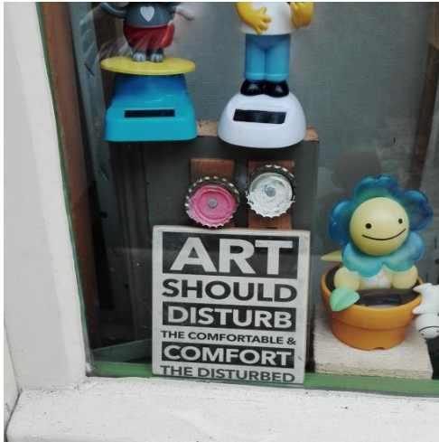
Abb. 1: Beispiel einer Linguistic Landscape aus Berlin