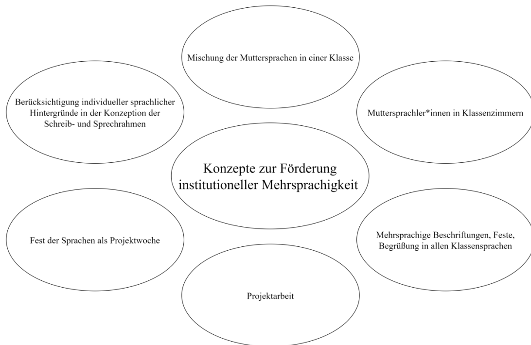
Abb. 4: Aktivitäten zur Förderung von Mehrsprachigkeit, die Lehrkräften bekannt sind bzw. bereits von ihnen im Englischunterricht verwendet wurden