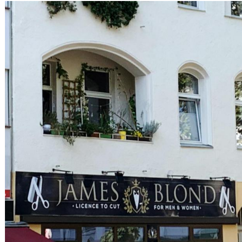
Abb. 2: Beispiel einer Linguistic Landscape aus Berlin

Diese können dann zur konkreten Spracharbeit genutzt werden (Lernende als code-breakers , Thematisierung von deliberate misspelling , Schulung der kommunikativen Fertigkeiten durch Präsentation der gesammelten linguistic landscapes ) (vgl. Sayer 2010), aber auch zur Förderung eines Mehrsprachigkeitsbewusstseins aufseiten der Lernenden z.B. indem etwaige Gründe für die Verwendung der jeweiligen Sprache diskutiert werden.