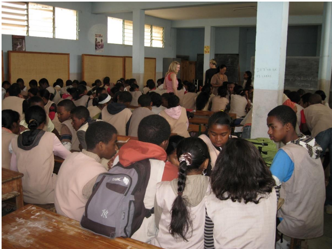
Abb. 2: Unterricht in einer Sekundarschule auf Madagaskar

Es handelt sich hier um eine Schulklasse auf Madagaskar, die in einer Sekundarschule Deutsch lernt und sich auf dem oberen A2-Niveau befindet. Es wird gerade die relativ ungewohnte Gruppenarbeit ausprobiert. Kolleg*innen aus Kamerun, einem Land mit mehr als 200.000 Deutschlernern, wird das Bild vertraut vorkommen. Auch dort gibt es in der Regel extrem große Klassen, in größtenteils allerdings kleineren Unterrichtsräumen. Auch in Asien sind annähernd große Unterrichtsgruppen nicht völlig unbekannt.