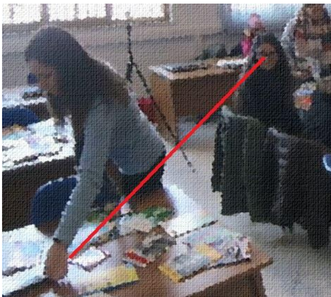
Abb. 4: L nimmt das zweite Buch