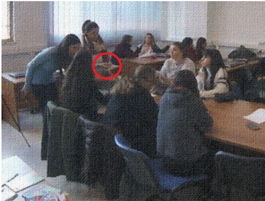
Abb. 6: Hast du das schon gelesen?

49 L tu hai già letto quello? du hast schon gelesen jenes? Hast du das schon gelesen? ((L schaut SA an, hält den Arm und die Hand noch weiter ausge- streckt)) ((SA schaut vor sich)) (Abb. 6)