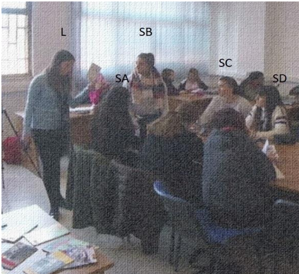
Abb. 5: Du kannst aufschreiben, dass du schon eins auf einem höheren Niveau gelesen hast