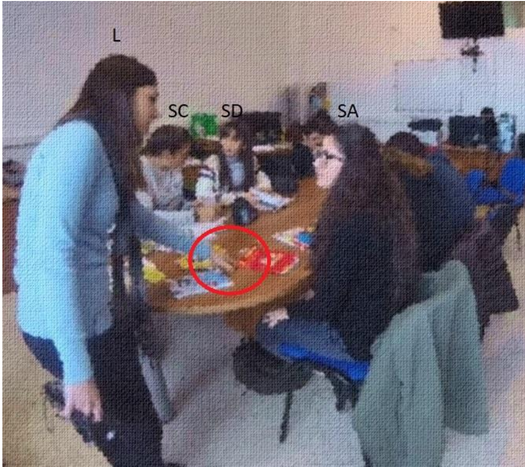
Abb. 3: Das war doch das Mädchen aus China