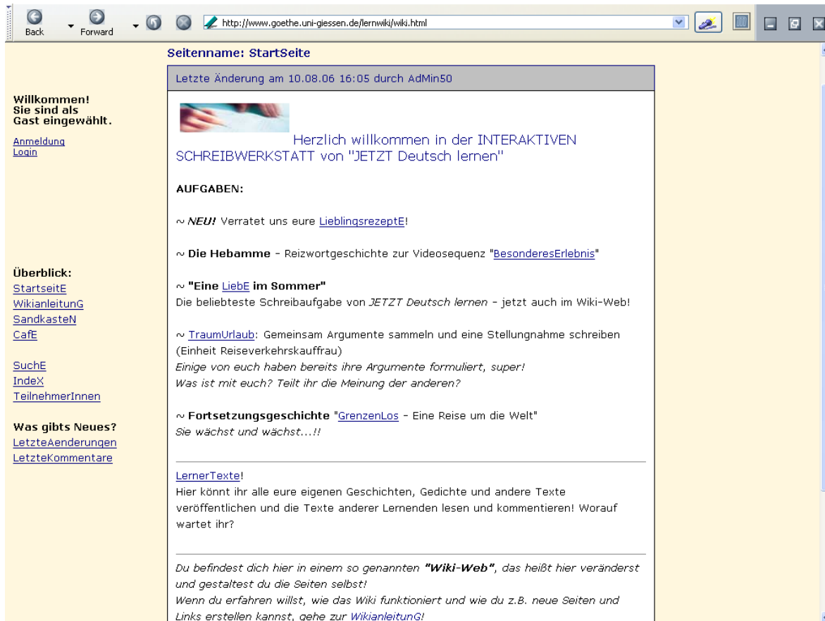
Abb. 2 Die Startseite der Interaktiven Schreibwerkstatt im Wiki-Web