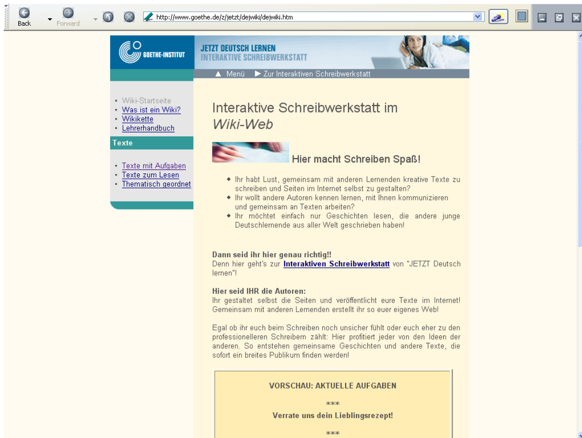
Abb. 1 Einstiegsseite mit Informationen über die Schreibwerkstatt für Lerner und Lehrer 11

Die Interaktive Schreibwerkstatt besteht aus den Seiten im Wiki-Web, d.h. der Schreibwerkstatt selbst, und der Einstiegsseite (siehe Abb. 1), die Links zu ausführlichen Informationen für Lehrende und Lernende bereit stellt, darunter zu den Seiten " Was ist ein Wiki?", die "Wikikette", die Netikette für das Wiki-Web, und das "Lehrerhandbuch".