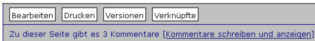
Abb. 3 Die Befehlszeile am Ende jeder Seite